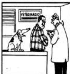
— Non-badiamo a spese!