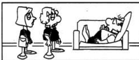
— Cupido lo ha colpito con una freccia al sonnifero.