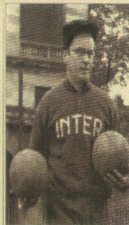
27 orizzontale. Nato a Muzzana del Tugnano (Uc) il 6 agosto 1911 e morto a Milano il 26 febbraio 1999. Attaccante, ha giocato nell'Inter dal 1936 al 1942, totalizzando 147 presenze e 49 reti.